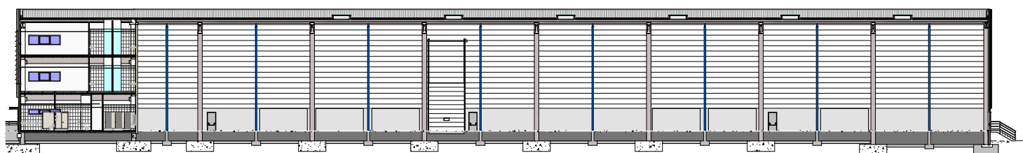
SECCIÓN TRANSVERSAL e: 1/600